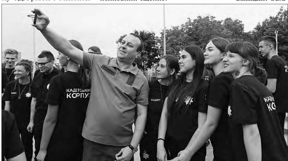
Кадети з начальником Вінницької ОВА Сергієм Борзовим.